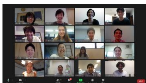
Web会議システムを活用