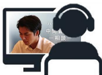
パソコンなどのデバイスで視聴