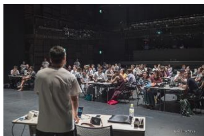
ファシリテーターを派遣