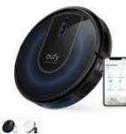
Eufy RoboVac G30 カラー：ホワイト、ブラック