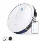
Eufy RoboVac 15C カラー：ホワイト、ブラック

https://www.anker-japan.com/pages/robovac-support