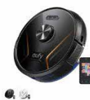
Eufy RoboVac X8 Hybrid カラー：ブラック、ホワイト