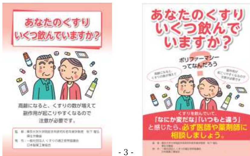
図1 一般社団法人くすりの適正使用協議会ウェブサイト「あなたのくすりいくつ飲んでいきますか」のパンフレット(図左)、ポスター(図右)のイメージ

https://www.rad-ar.or.jp/knowledge/post?slug=polypharmacy