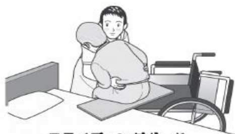
スライディングボード

対象者の体幹をやや前傾した状態で、左右交互に傾けて荷重を片側の臀部にかけ、次に荷重がかかっていない臀部の膝を車椅子背もたれ方向へ押すことで深く座ることができる。滑りにくい座面の場合は、片側のみスライディングシートを座面に敷き、同様に膝を押すことで滑りやすくなり深く座ることができる。