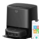
Eufy Clean X9 Pro with Auto-Clean Station カラー：ブラック