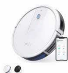
Eufy RoboVac 15C カラー：ホワイト、ブラック

https://www.ankerjapan.com/pages/robovac-support