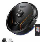
Eufy RoboVac X8 Hybrid カラー：ブラック、ホワイト