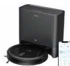
Eufy Clean G40 Hybrid+ カラー：ブラック