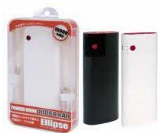
パワーバンクエリプス 10000mAh (HRN-265)