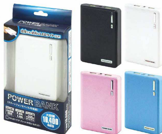
パワーバンク 10400mAh (HAC1182)