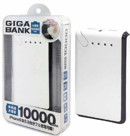
ギガバンク 10000mAh (HAC1078)