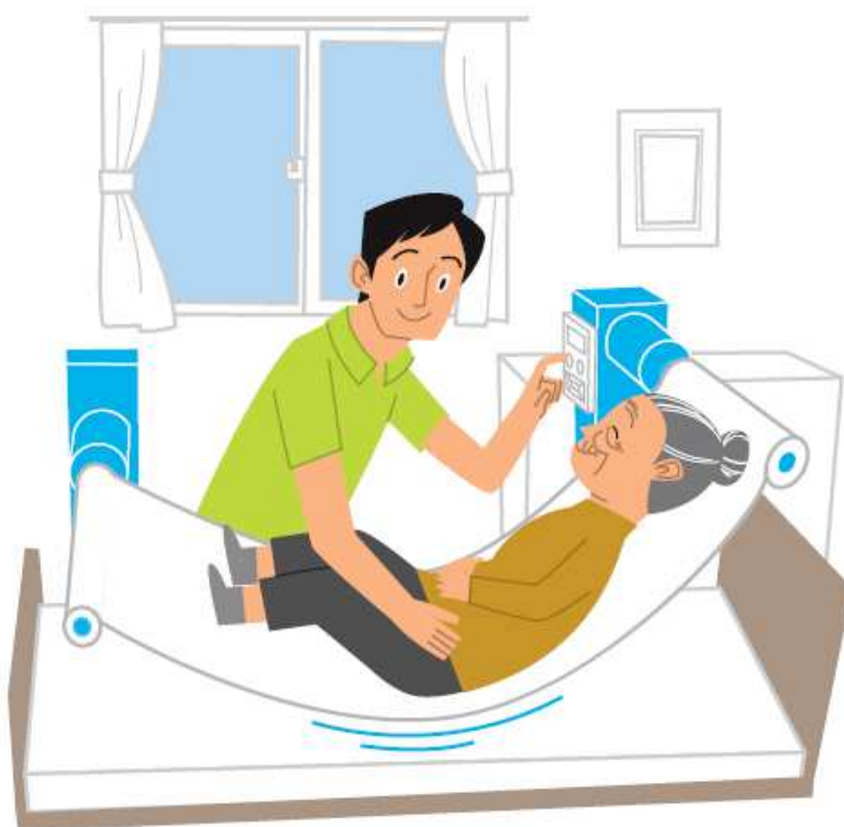
重点分野のイメージ

※ 「ロボット介護機器開発・導入促進事業（開発補助事業）研究基本計画」（経済産業省 製造産業局 産業機械課（平成29年10月）） <抜粋>