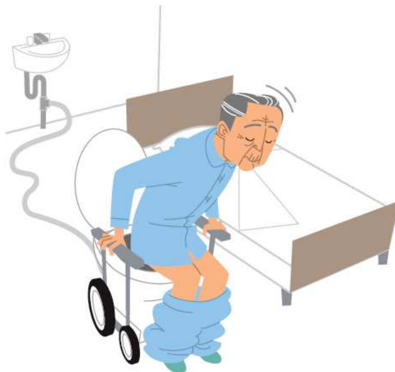
重点分野のイメージ

※ 「ロボット介護機器開発・導入促進事業（開発補助事業）研究基本計画」（経済産業省 製造産業局 産業機械課（平成29年10月））＜抜粋＞