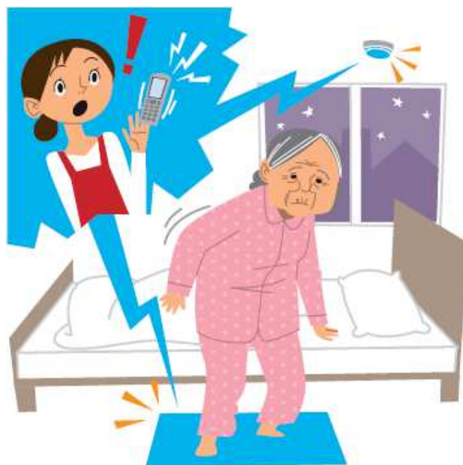
重点分野のイメージ

※ 「ロボット介護機器開発・導入促進事業（開発補助事業）研究基本計画」（経済産業省 製造産業局 産業機械課（平成29年10月））＜抜粋＞