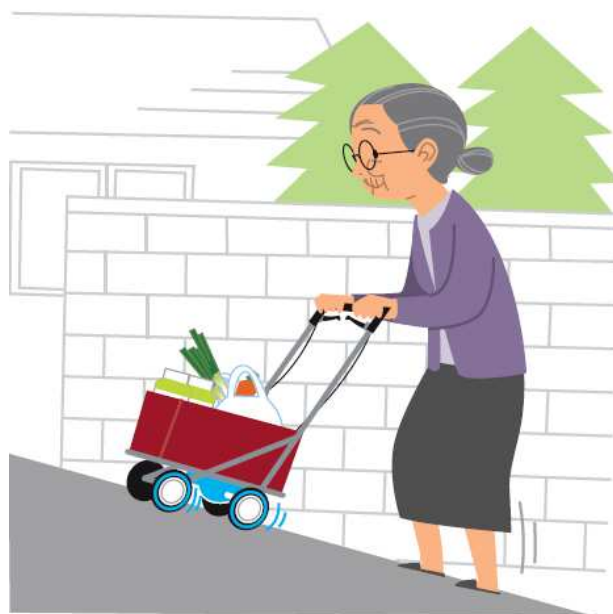
重点分野のイメージ

※「ロボット介護機器開発・導入促進事業(開発補助事業)研究基本計画」 (経済産業省 製造産業局 産業機械課 (平成29年10月)) <抜粋>