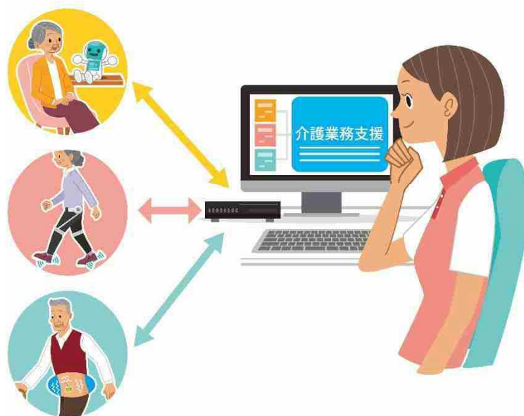
重点分野のイメージ

※ 「ロボット介護機器開発・導入促進事業（開発補助事業）研究基本計画」（経済産業省 製造産業局 産業機械課（平成29年10月））＜抜粋＞